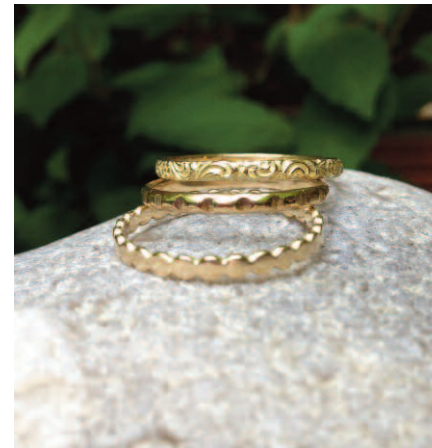
Les bagues VERA, CARLA et POLA, collection Semainiers, Or 18 carats labellisé Fairmined.