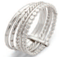
La bague BILLIE, collection Semainiers, 5 anneaux ciselés en argent 925.