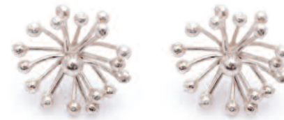
Les boucles d'oreilles FLORENCE, collection Flower, argent 925, granulation.