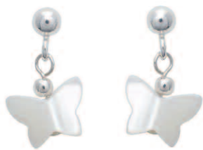
Les boucles d'oreilles LIZA, collection Alouette, en argent 925 et nacre.