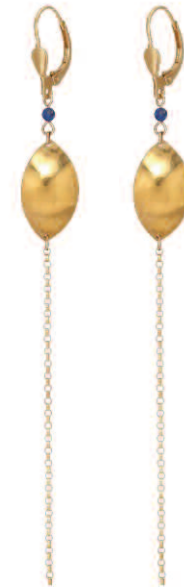
Les boucles d'oreilles PATTY collection Pétales, or jaune 18 carats et lapis-lazuli..

Chacun de mes bijoux, certifié et poinçonné, respecte au maximum la filière éco-responsable. Tous sont disponibles en ligne sur l'e-shop, à l'atelier sur rendez-vous pour un essai, une commande de pièce sur mesure, un moment d'échange ou à l'occasion de portes-ouvertes ou d'événements privés.