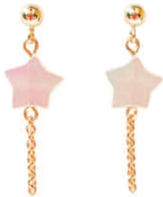
Les boucles d'oreilles SARAH, collection Alouette, or 18 carats et nacre.

En argent 925 ou mixé avec de l'or 18 carats, leurs formes douces et facétieuses constituent de précieux souvenirs.