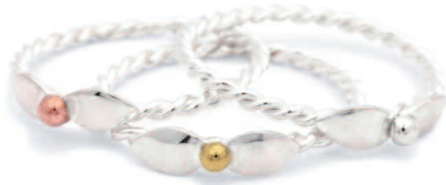
Les bagues SOFIA, NATALIA et PAULINE de la collection Pétales : argent 925 et or 18 carats labellisé Fairmined

Je suis convaincue qu'il faut donner une dimension éthique à notre mode de consommation, c'est pourquoi je privilégie pour la réalisation de mes bijoux des métaux labellisés "Fairmined". Ce label de certification atteste la provenance de l'or 18 carats et de l'argent 925 produits à petite échelle par des mines artisanales, respectueuses