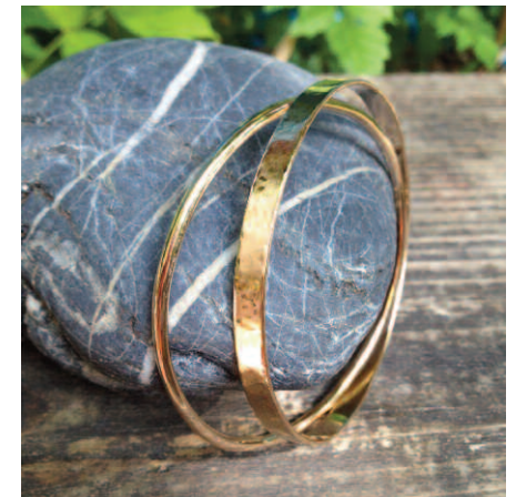
Les jons COSMO et LUKA, collection Only, Or 18 carats labellisé Fairmined..