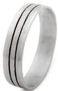
La bague VITO, collection Sillages, argent 925, ciselé et oxydé, brossé mat.